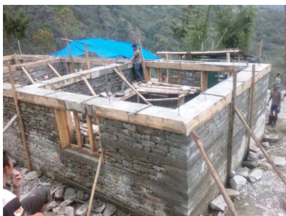
Bau von drei Klassenräumen