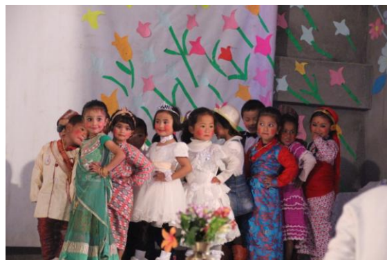
Modenschau der Kindergartenkinder

Unser Schulleiter vergaß aber auch nicht, die Bauarbeiter auf die Bühne zu bitten und für die großartige Arbeit zu danken.