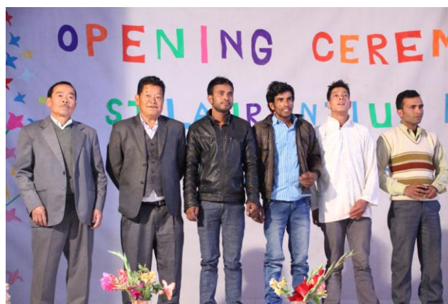
Ehrung der Bauarbeiter