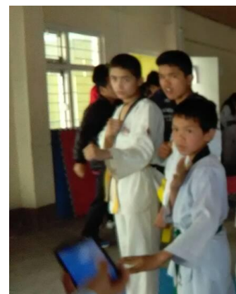
Erfolge im Taekwondo