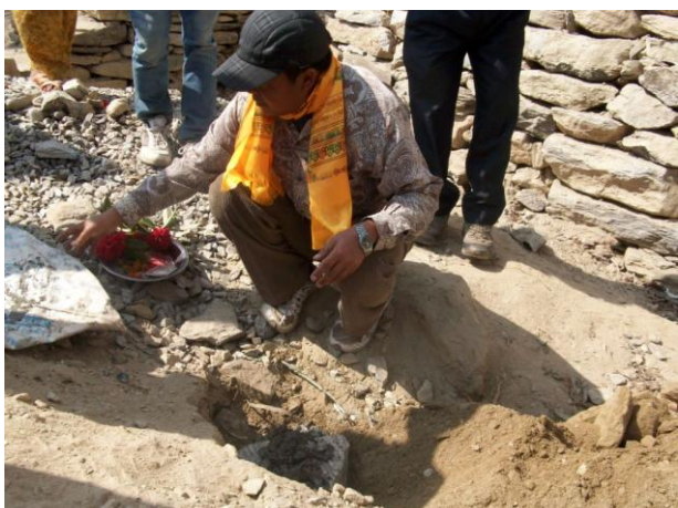
Grundsteinlegung im Februar 2017

Nachdem unsere Partner vor Ort in Nepal die bürokratischen Hürden erfolgreich gemeistert hatten und das Jahr 2016 im Zeichen der Vorbereitungen wie Sammeln von Holz und Beschaffen von Ziegeln stand, waren wir überrascht, wie schnell es im Frühjahr 2017 voran ging. Im Februar 2017 fand die Grundsteinlegung statt, bis ca. Mitte Juni konnte am Bau des ersten Gebäudetraktes gearbeitet und drei Klassenräume fertig gestellt werden.