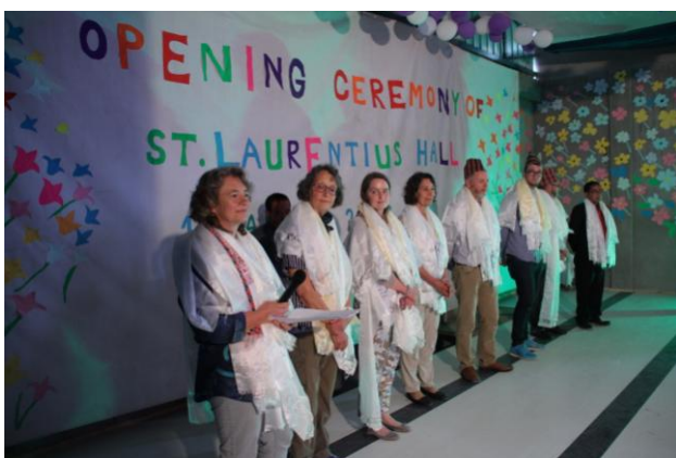
Überreichen von Khaddas (weiße Schals) als Zeichen des Danks

Wir wurden ebenfalls auf die Bühne gebeten: Zum einen hatten wir natürlich auch eine Rede vorbereitet, um all den unglaublich engagierten Menschen zu danken, die es ermöglichen, dass hier solch eine wunderbare Schule entsteht, die ein Lern- und Lebensort für mittlerweile 120 Kinder geworden ist. Anschließend kamen die Eltern und andere Gäste zu uns auf die Bühne, um uns Khaddas (weiße Schals) zu überreichen – ein Zeichen der Dankbarkeit und guter Wünsche.