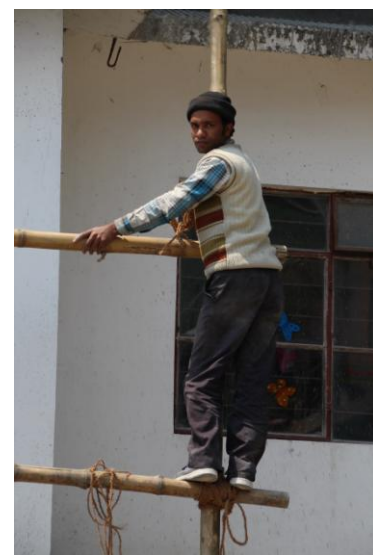
Bauarbeiten unter beschwerlichen Bedingungen

Zu Schuljahresbeginn Anfang März 2017 - unser achttes Jahr seit Eröffnung der Schule - begrüßten wir 120 Kinder in 9 Klassen (4 Kindergartenklassen und die Klasse 1-5), neun Lehrerinnen, einen Sportlehrer, eine Fachlehrerin für die Naturwissenschaften und drei Helferinnen. Dank der erneuten großzügigen Spende konnte das Snack- und Milchprojekt fortgeführt werden. Täglich bekamen die Kinder eine Tasse Milch und ein Stück Obst, Nüsse oder ein Ei.