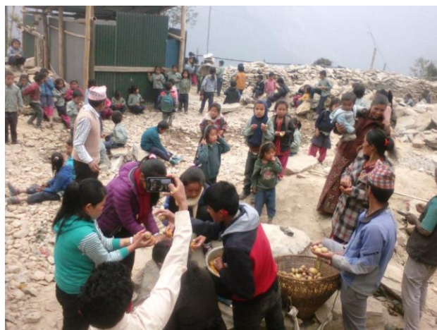
Feier der Grundsteinlegung