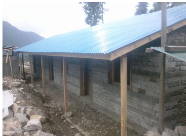
Der erste Gebäudetrakt ist fertig

Im Sommer ist es wegen der Regenzeit nicht möglich, Bauprojekte fortzusetzen. Im Oktober wurden nun kleine Innenarbeiten gemacht. Nach der Erntezeit wird nun mit dem zweiten Bauabschnitt begonnen. Ganga Khadka, unser Partner vor Ort, der selbst in dem Dorf wohnt, hat geplant, dass der zweite Gebäudeteil im Frühjahr 2018 fertig gestellt werden kann.