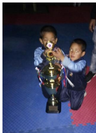
4 Gold- und 2 Silbermedaillen