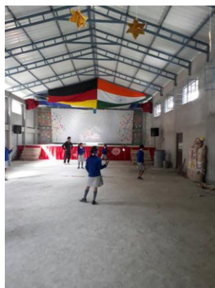
Die Aula als Sporthalle