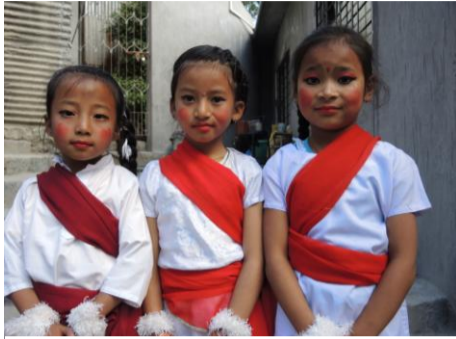
Aufführung traditioneller Tänze

Ein weiterer Höhepunkt meiner Reise war das Schulendfestival im Dezember mit ca. 200 Zuschauern, einem 4-stündigen Programm und Zeugnisausgabe. Ich bin noch ganz beeindruckt von den vielen Aufführungen wie Tänze, Gesang, Theater, usw., die einfach zeigen, wie engagiert an unserer Schule gearbeitet wird.