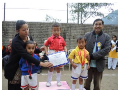
Siegerehrung beim Sportfest