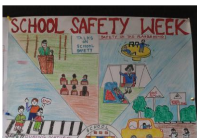
Plakat zur Sicherheitswoche

Neben dem alltäglichen Unterricht fanden monatliche Wettbewerbe (Tanz, Singen, Quiz, usw.), eine Pflanzaktion im Rahmen der Umweltwoche in Darjeeling, ein gemeinsamer Schulausflug aller Schüler, Teachers Day, Sportfest, Taekwondo-Kurs, Kunstaussstellung, Medical Camp zur Vorsorgeuntersuchung, Feierlichkeiten zum Independence Day und Childrens Day statt. Außerdem wurde in diesem Jahr eine „Sicherheitswoche“ zum Thema Verhalten im Falle eines Erdbebens bzw. Erdbebens und ein Elternseminar durchgeführt, bei dem mindestens ein Elternteil aller Schüler anwesend war. Diese Resonanz hatte noch nicht einmal unser Schulleiter erwartet. Besonders erfreulich ist, dass wir das im April 2011 gestartete Milch- und Snackprojekt weiterhin fortsetzen und somit einen Beitrag zur gesunden Ernährung leisten konnten.