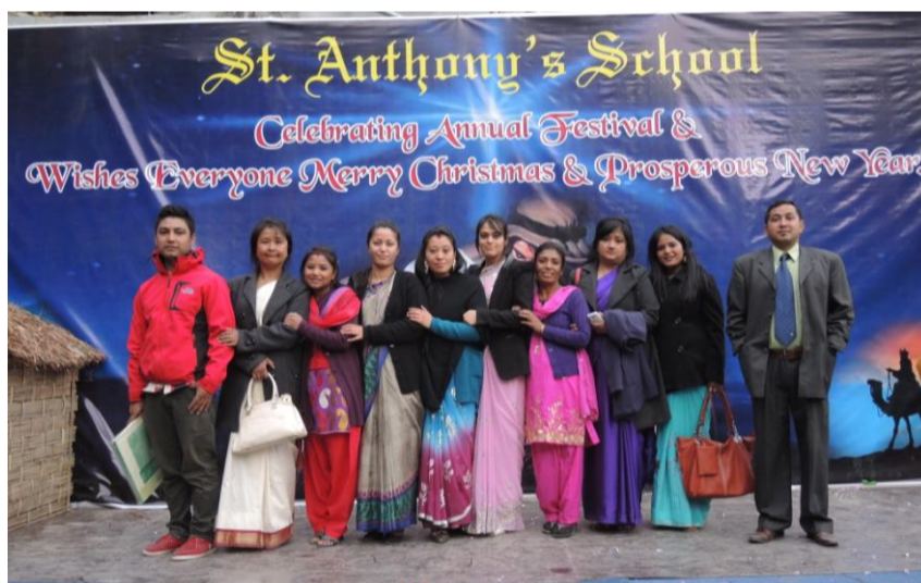
Unser engagiertes Lehrerkollegium vor dem Bühnenbild beim Schulendfestival

Zum Schluss möchten wir darauf hinweisen, dass der komplette Vorstand ehrenamtlich arbeitet und die Reisen nach Darjeeling privat finanziert werden. Alle Spenden verwenden wir für unsere Arbeit in Darjeeling. Den kleinen Betrag zur Deckung der Bürokosten wie z.B. Portokosten, Überweisungsgebühren, Homepage finanzieren wir durch den Verkauf von selbst hergestellten Waren, die uns unsere „Bastelgruppe“ zur Verfügung stellt. Die Homepage ( www.darjeelinghilfe.de ) wird in Kürze aktualisiert, so dass Sie einige Fotos und Videos zu den im Herbst stattgefundenen Aktivitäten wie Sportfest und Schulendfestival sehen können. Die Spendenquittungen (ab 50,00 Euro) schicken wir Ihnen wieder wie gewohnt im Januar zu.