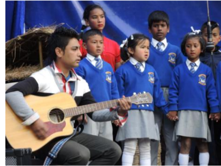
Schulchor: „We are the world“

Nun können die Schüler die langen Winterferien bis Anfang März 2015 genießen. Insbesondere im Januar und Februar ist es in Darjeeling so kalt, dass viele Familien, die z.B. Verwandte im Tiefland haben, die Zeit dort überbrücken. Doch die Schüler, die trotz der Kälte in Darjeeling bleiben müssen, haben die Möglichkeit, an einem Taekwondo-Training teilzunehmen, das unser neuer Sportlehrer in den Winterferien anbietet.