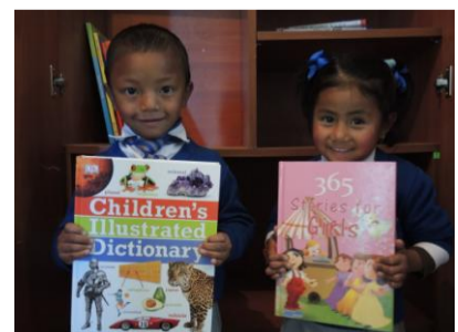
Eröffnung der Bücherei